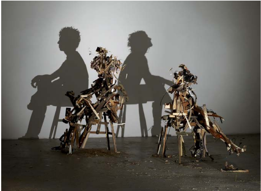
© Tim Noble & Sue Webster